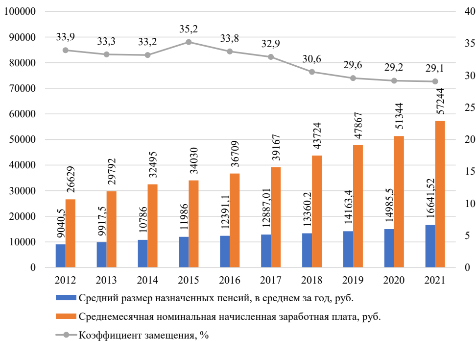
Рис. 1. Коэффициент замещения в России, 2012–2021 гг. Fig. 1. Replacement rate in Russia, 2012–2021

На эффективность работы системы ОПС во многом влияют демографическая ситуация в обществе и уровень налоговой нагрузки на трудоспособное население страны. Т. В. Муравлева отмечает, что т. к. взносы работающего населения идут на выплаты пенсионерам, то распределительный тип финансирования государственного пенсионного страхования