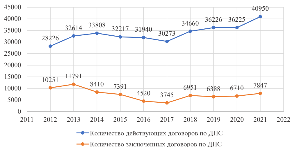
Рис. 3. Количество заключенных и действующих договоров добровольного пенсионного страхования, 2011–2022 гг. Fig. 3. Number of concluded and running voluntary pension insurance contracts, 2011–2022

Общее количество заключенных договоров по ДПС планомерно уменьшалось с 2013 по 2017 г. Лишь с 2018 г. показатель снова начал расти,