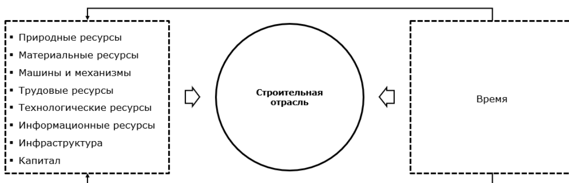
Рис. 2. Ресурсная обеспеченность строительной отрасли

– Отдельно необходимо упомянуть сферу инжиниринга, которая является крайне важной составляющей строительной отрасли ввиду невозможности