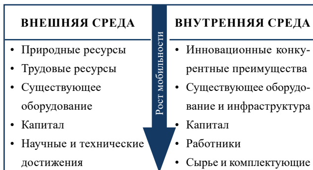
Рис. 1. Ранжирование стратегических экономических факторов по степени мобильности

Схематично ресурсы, доступные во внешней и внутренней региональной экономической системе, по степени мобильности можно представить следующим образом (рис. 1 21 ):